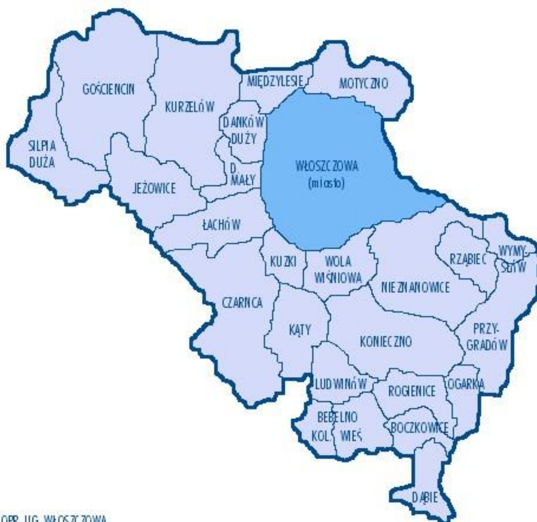
Rysunek 2. Sołectwa wchodzące w skład gminy Włoszczowa.