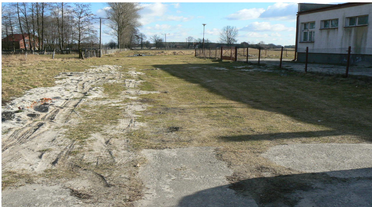
Fot. 7. Dojście do terenu sportowego przy Zespole Placówek Oświatowych w Kurzelowie