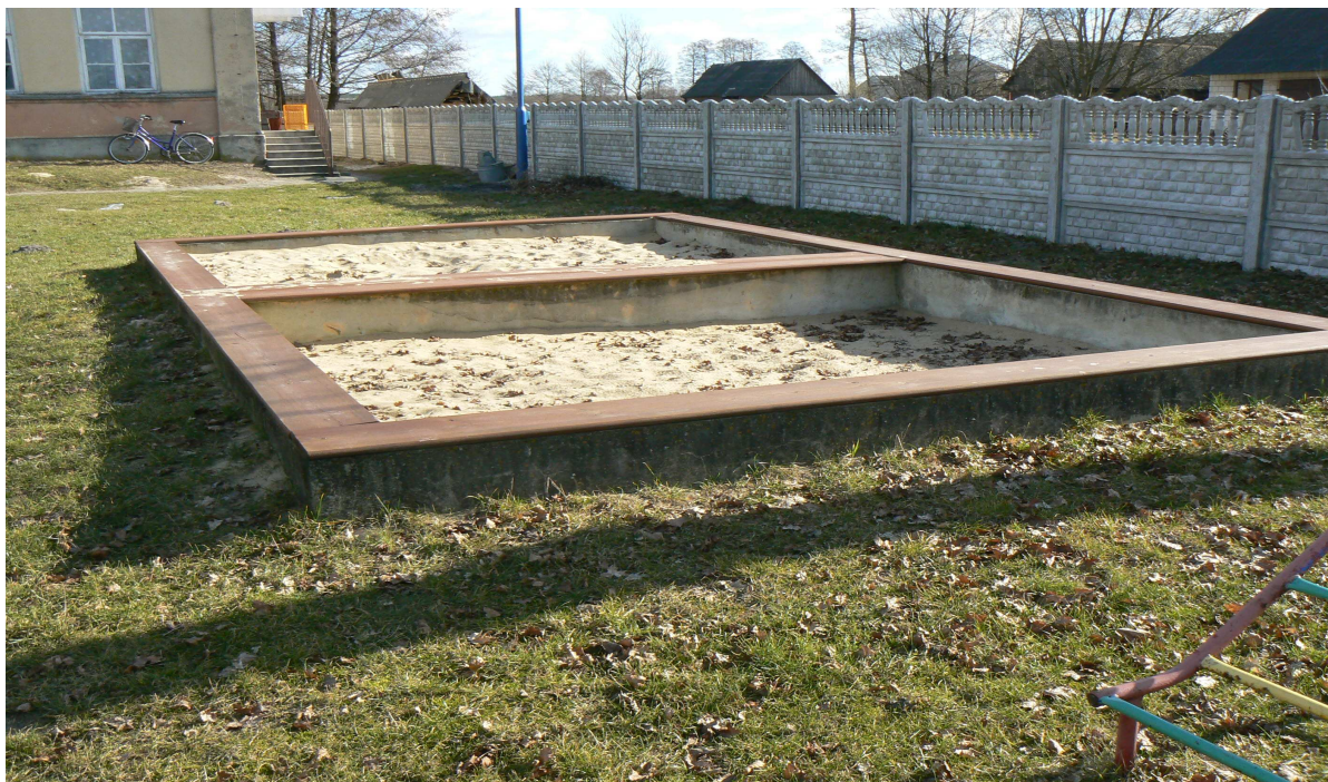
Fot. 2. Piaskownica wymagająca remontu