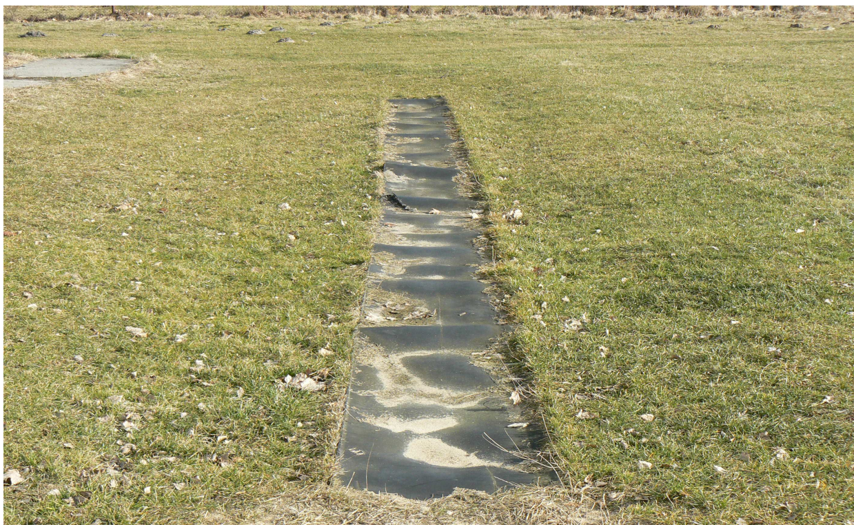
Fot.5. Bieżnia do skoku w dal