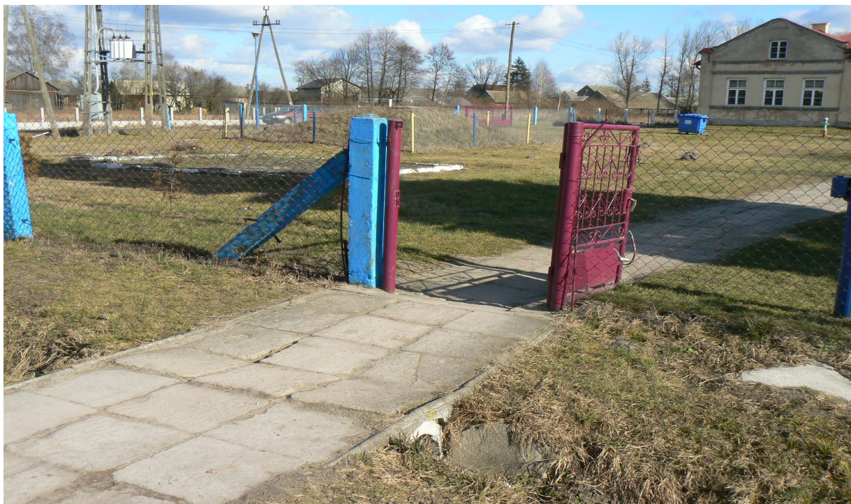
Fot. 4. Wejście na plac zabaw od strony drogi powiatowej