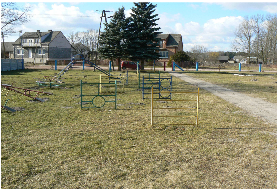
Fot. 1. Elementy placu zabaw przy Przedszkolu Samorządowym w Kurzelowie

Poniżej zamieszczono zdjęcia przedstawiające teren realizacji pierwszego zadania, które uznano za priorytetowe.