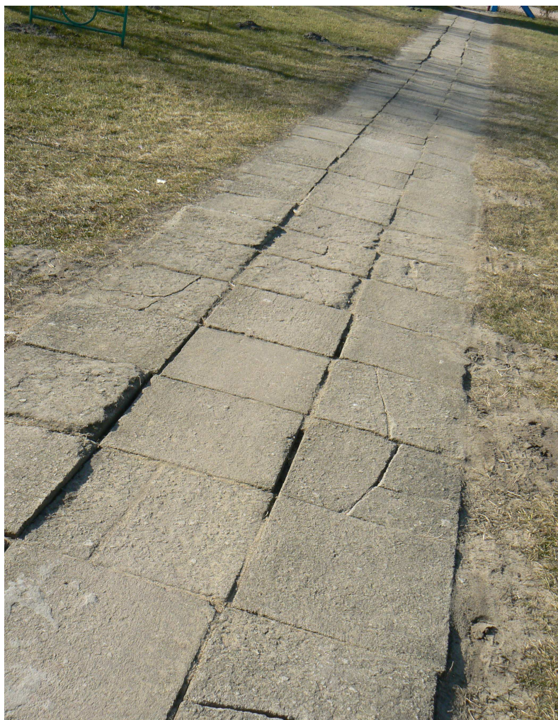
Fot. 3. Chodnik na terenie placu zabaw