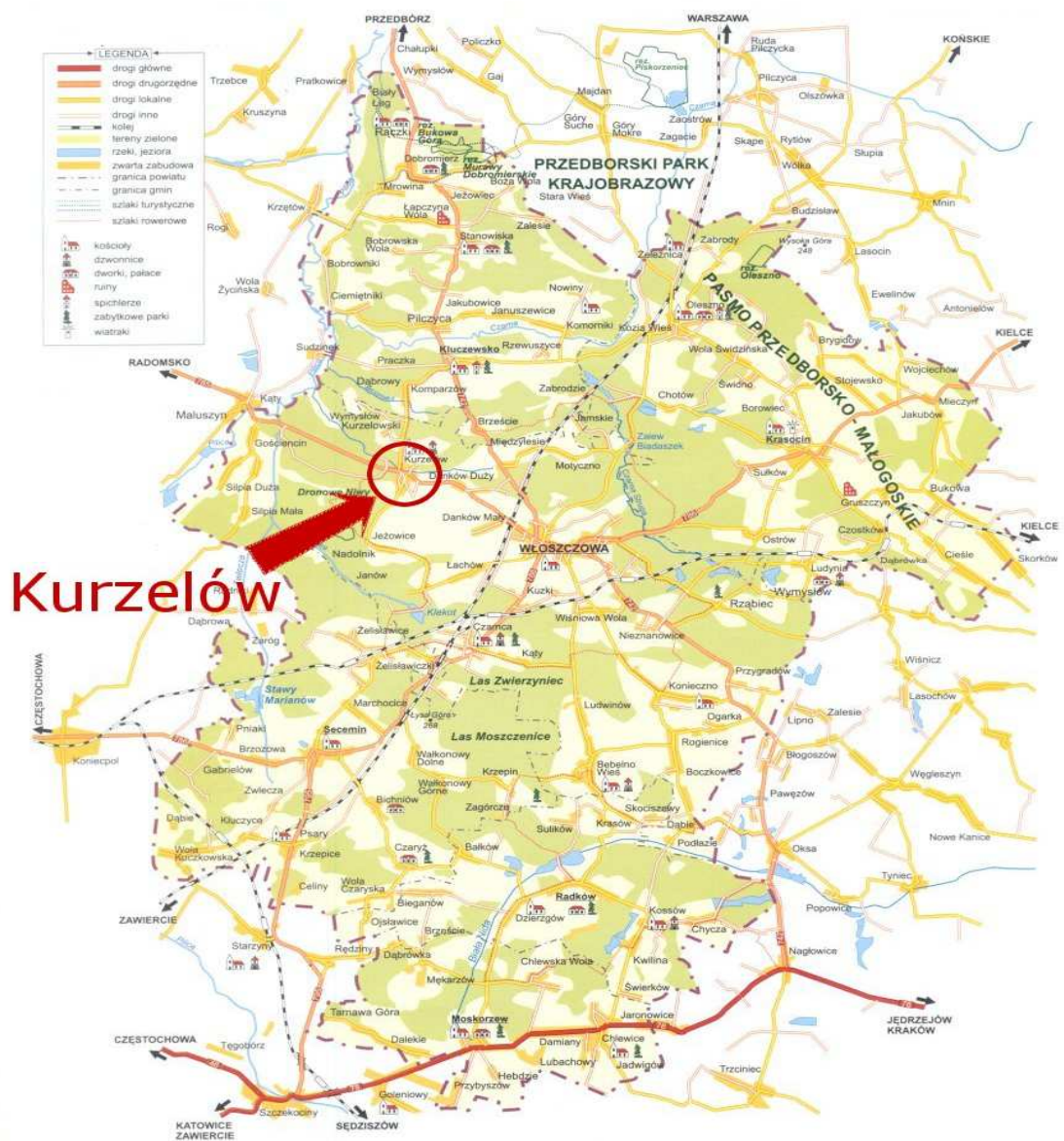
Mapa 1. Usytuowanie miejscowości Kurzelów na tle Powiatu Włoszczowskiego

Obecnie jest to jedno z sołectw Gminy Włoszczowa liczące 1132 mieszkańców (stan na 31.12.2007 r.). Położone jest w północno - zachodniej części Gminy Włoszczowa i zajmuje powierzchnię 2328 ha.