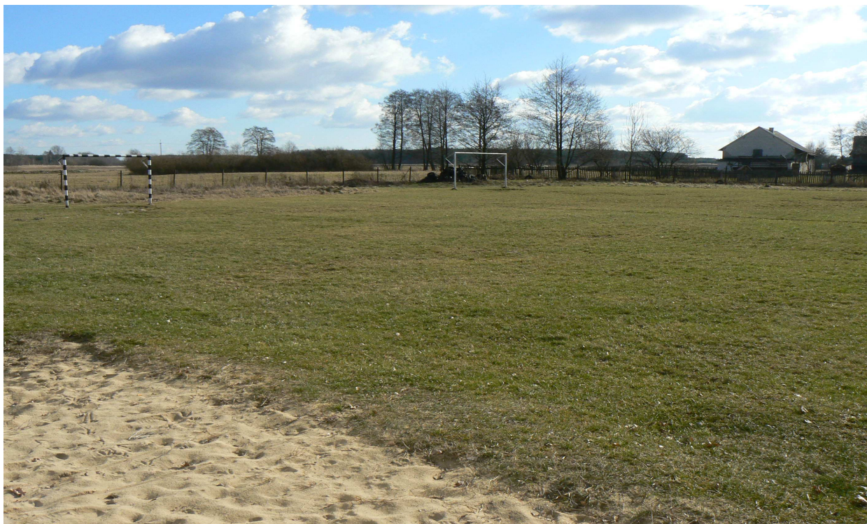
Fot. 6. Boiska sportowe